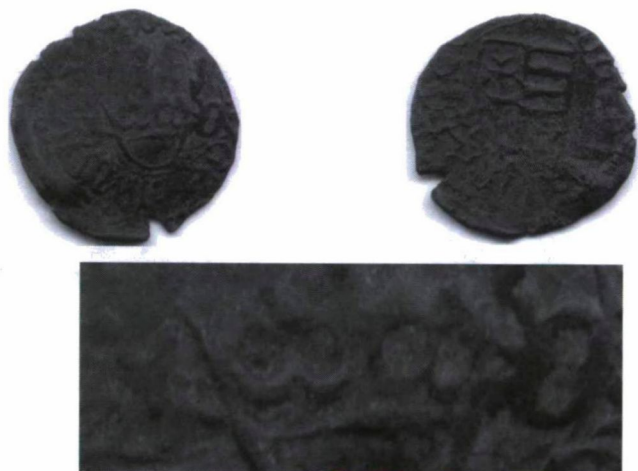
2. kép: H 603/a I – fordított C