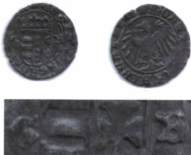
1. kép: H 605 G – B