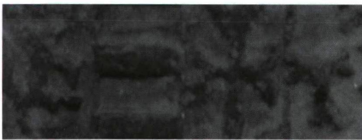
4. kép: H 607 h – T