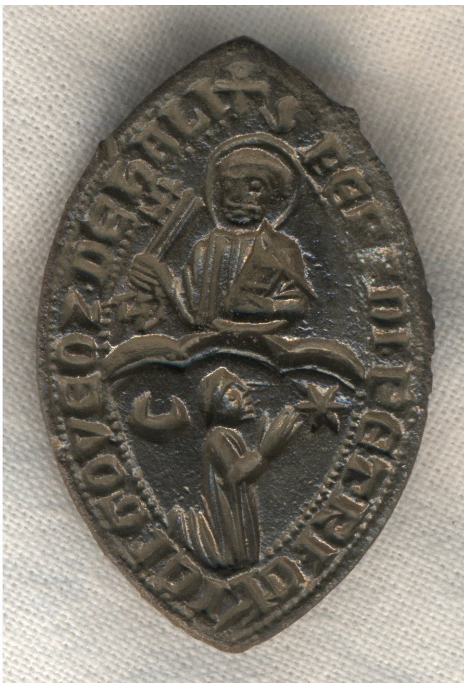
1–2. kép. A bátmonostori pecsétnyomó előlapja és tükörképe