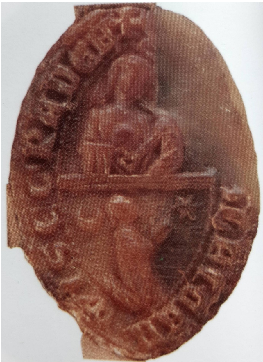
3. kép. Miklós vyšehradi kanonok pecsétje (CDB 2013. 30/73) 38