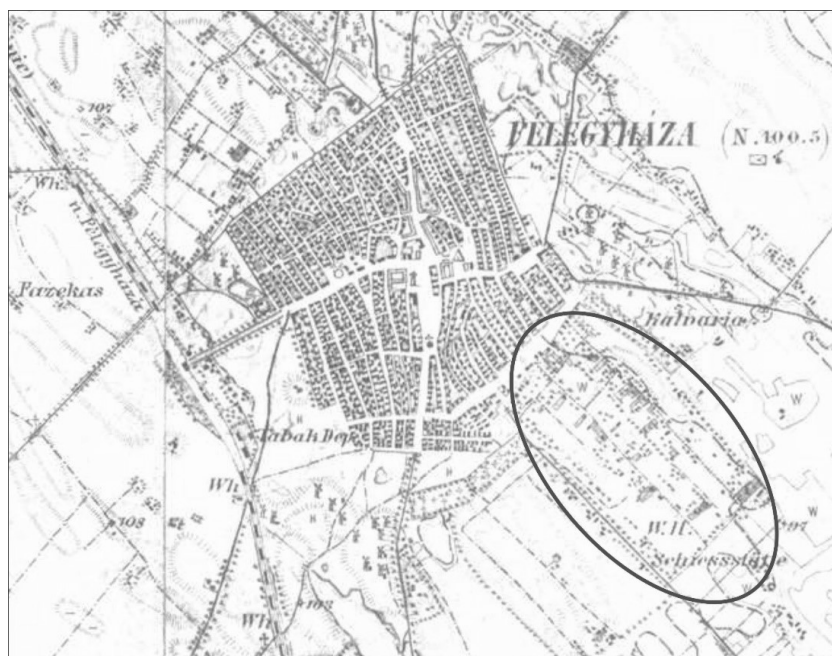
1. ábra: A III. katonai felmérés Kiskunfélegyházáról, a pirossal keretezett rész a Közelszőlő