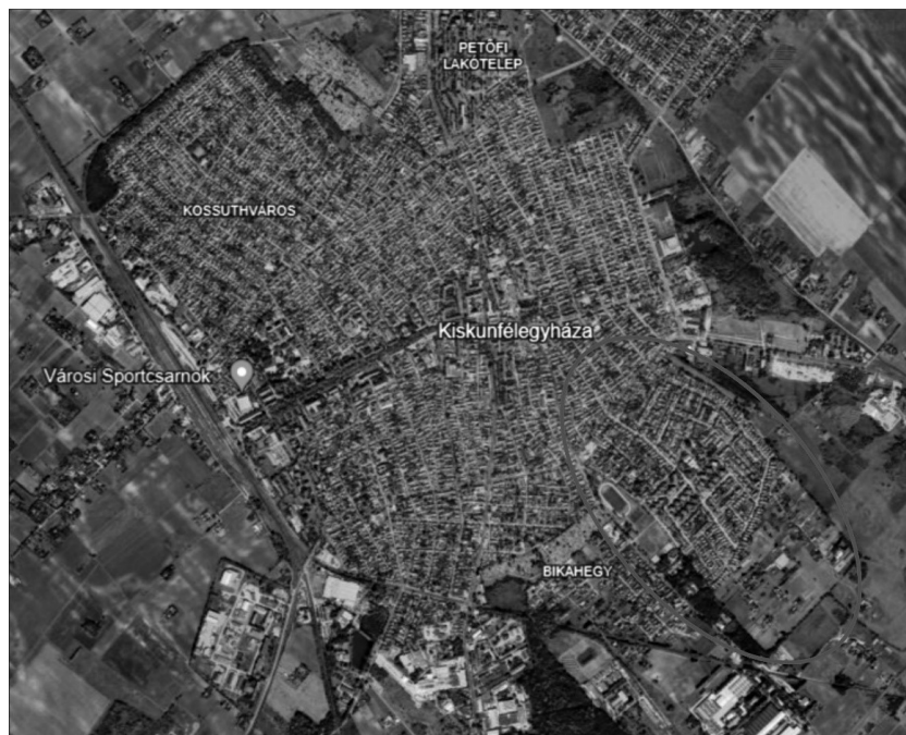
2. ábra: Google Earth felvétel Kiskunfélegyházáról napjainkban