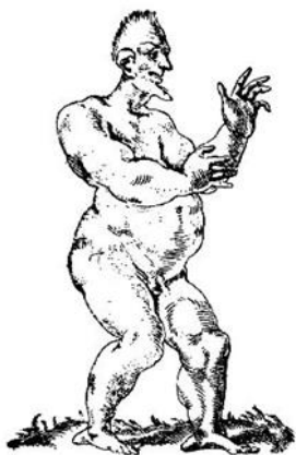
4. ábra: Bestiálisan rosszindulatú ember

természetes, fiziológiai magyarázata van annak, hogy a csúfak gonoszak, a szépek pedig jók, a testnedvek mértéktelen és rossz összetétele ugyanis a testrészeket is rosszul rakja össze, és a testnedvek aránytalan mivolta okozza a vétkeket és a rossz erkölcsöket: tehát a rossz erkölcsök a csúnyaságból erednek. 27