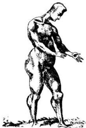
5. ábra: A legrosszabb erkölcsi tulajdonságú férfi

G. B. Della Porta, Della Fisonomia dell'huomo (1610)