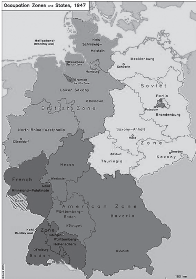
Map 1.: Occupation zones of Germany in 1947