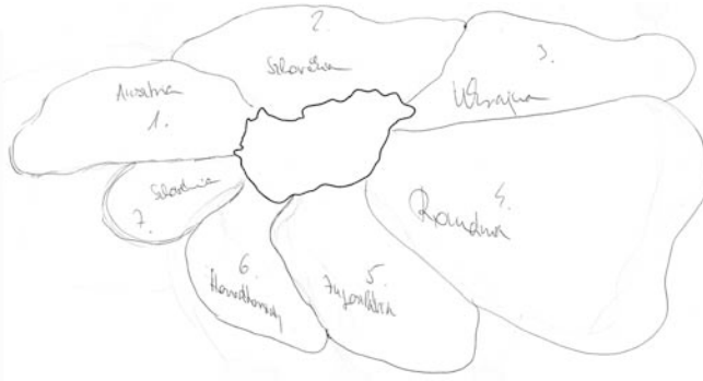
2. ábra. Tipikus „virágsziromszerű” mentális térkép hazánk szomszédairól