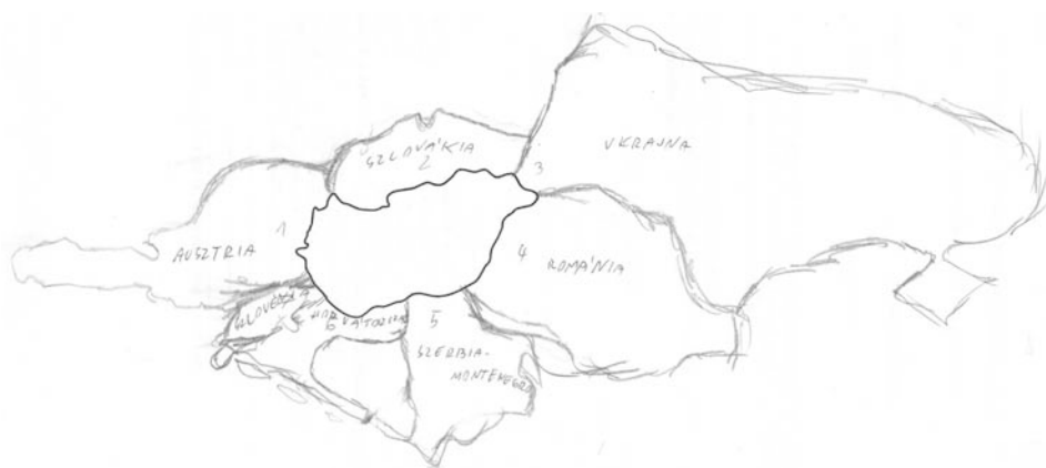
1. ábra. 15 éves tanuló mentális térképe hazánk szomszédairól