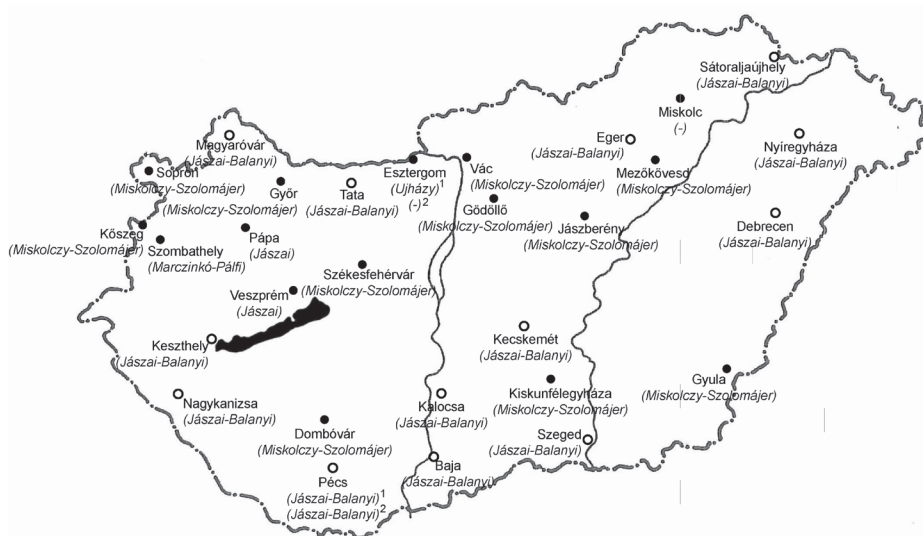
1. ábra. A vidéki római katolikus fiú középiskolák VIII. osztályos történelem tankönyvválasztásának térbeli kiterjedése (1930-as évek eleje)