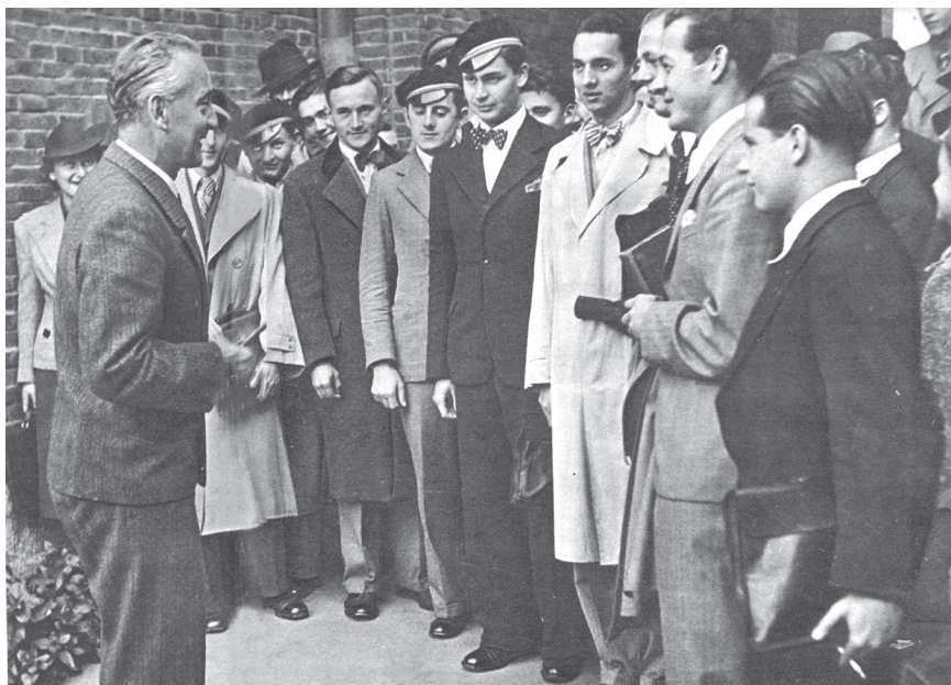
2. ábra. Szent-Györgyi Albert tanítványaival