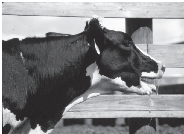
3. ábra. A globális felmelegedés okozta hőstressztől szenvedő tejelő tehén (Baumgard, 2010).

A neutrális hőmérsékleti zóna felső határát jelző kiritikus környezeti hőmérséklet felett az állati szervezet a testhőmérséklet hűtése érdekében, a metabolikus folyamatok lassítása mellett, számos más életfolyamattal igyekszik alkalmazkodni. Ezek között jelentős szerepet tölt be a párologtatás (a legtöbb állat esetében verejtékezés a bőrfelületen keresztül; a ragadozóknak lihegéssel a nyál elpárologtatásával), amely folyamatok döntően befolyásolják a szervezet vízháztartását. Ennek egyik eredménye a nyáltermelés csökkenése. A nyál az állatokban lényeges emésztőnedv. Kérdőzkben a testmérethez viszonyítottan bőséges nyáltermelésnek az előgyomrokban (bendő-recés egység) történő mikrobiális emésztésben, ezen keresztül a növényi rostok lebontásában fontos szabályozó funkciója van. Nagy puffer kapacitásának köszönhetően hozzájárul ahhoz, hogy a mikrobák által termelt nagy mennyiségű rövid szénláncú zsírsav (ecetsav, propionsav, vajsav, tejsav, stb.) produkció ellenére a gyomor pH-értéke a neutrálishoz közeli tartományban maradjon. A magas környezeti hőmérséklet hatására csökkenő nyáltermelés