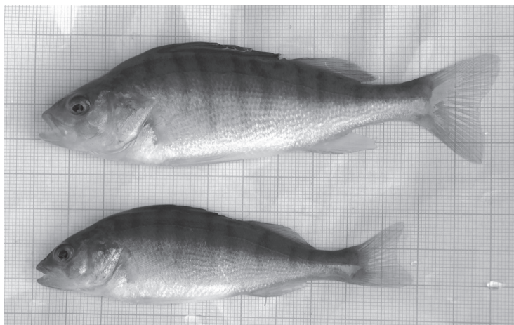
2. ábra. Azonos korú csapósügerek jellemző méretbeli különbsége. Felül ikrás (nőtény), alul tejes (hím)

Vizeink éves átlaghőmérsékletének változását ugyan még a legmerészebb klíma-prognózisok sem jelzik akár 50 éven belül sem 5 °C-nál magasabbra, az viszont igen valószínű, hogy egy-egy rövid időszakra, például négy-öt napra a szokásosnál akár 10 fokkal is melegebb lehet egy tó vize. Ebből az következik, hogy ha ez a hőmérséklet egy halembrió fejlődésének „ivari szempontból érzékeny” szakaszára esik, akkor komolyan befolyásolhatja annak ivarfejlődését.