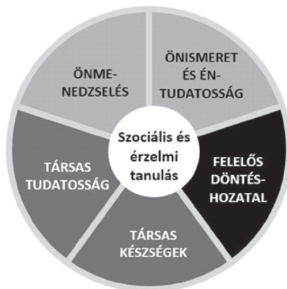
1. ábra. A SEL-programok fejlesztési területei

Az intézményes fejlesztés lehetőségeivel foglalkozó kutatók (pl. Elbertson, Brackett, Weissberg, 2009; Schuttel, Malouff, Einar és Thorsteinsson, 2013; Zins és Elias, 2006 ) öt olyan, a szociális és az érzelmi fejlődésben meghatározó szerepet játszó faktort emelnek ki, amelyek fejlesztése kulcsfontosságú. Ez az önismeret és éntudatosság, az önmenedzselés, a társas tudatosság, a társas készségek és a felelős döntéshozatal. Ezzel teljesen megegyezik az USA-ban vezető szerepet betöltő Collaborative for Academic, Social and Emotional Learning (CASEL) chicagói székhelyű szervezet munkatársai által készített modell is, ami az öt fő fejlesztési terület egymáshoz való viszonyát mutatja be (1. ábra).