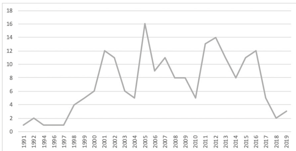
2. ábra. A cikkek megoszlása a megjelenés éve szerint

A megjelenés éve (2. ábra) alapján nem tudunk trendeket azonosítani, inkább csak az állapítható meg, hogy 1997/1998-tól folyamatosan nő a témában megjelenő cikkek száma, és van néhány kiugró év, így 2005 vagy 2012, amikor a legtöbb eredményességgel foglalkozó írás jelent meg.