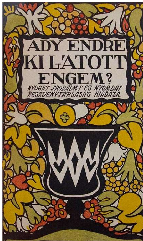
2. kép Ady-kötet címlapja (Petőfi Irodalmi Múzeum 1 )

Mint alkotó, egyé válik a természettel, a kerttel, s általában a valóság dolgaival (jellegzetes Lesznai-vonás). Ezt írja: