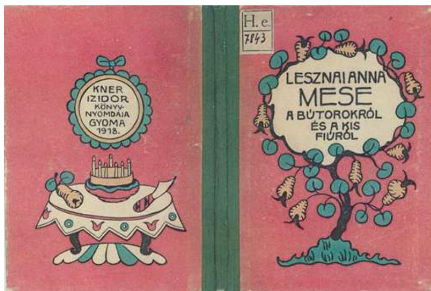
5. kép Címlap Mese a bútorokról és a kislőről

A mese a kislőről... tanmese, önálló kötetben jelent meg 1918-ban Kner Izidor nyomdájában, Gyomán. A kötetet fiának ajándékba készítette az író (5. kép).