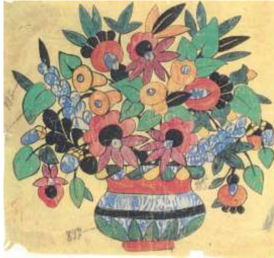
1. kép Rusztikus csokor öblös vázában (Lesznai–Képeskönyv 21.)