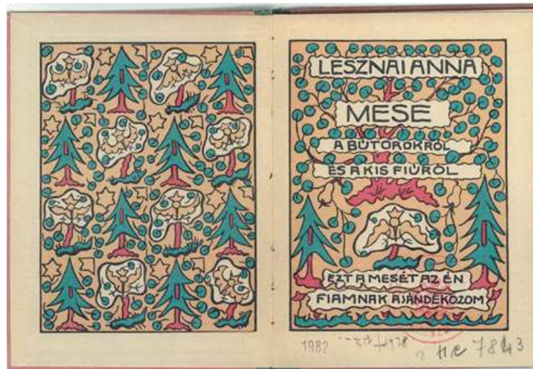
8. kép Mese a bútorokról és a kisfiúról – belső címlap

Az első és hátsó borító belső része is tele van rajzzal (4. kép) mesefenyővel, mesébe illő lombos fával, az utóbbi mindegyikén ott a csillagmadár. A fák közötti részt levelek, csillagok töltik ki, olyan, mint egy színes szőttes; nincs benne kihasználatlan felület. A belső címlapon az ajánlás olvasható: „Ezt a mesét az én fiamnak ajándékozom” (8. kép).