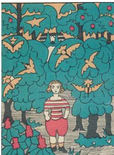
6. kép Mentek, mendegéltek Péterke és a csillagmadár (Mese a bútorokról és a kisleányról 9)

„Mentek, mendegéltek tovább Péterke és a csillagmadár. Tágult a faszor, világosabb is lett. Ezer meg ezer csillagmadár szállott a faágak közé, ott fickándoztak és csillogtak.” (6. kép)