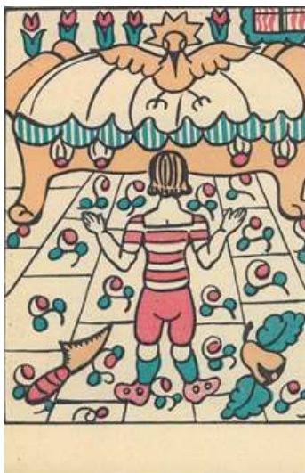
7. kép Elkészült az ág. Gyönyörű szép volt szemre. (Mese a bútorokról és a kisleányról 23)

Az utóbbi jelenetet színes képen is ábrázolja vonalvezetése, színvilága szecessziós jellegű csakúgy, mint az írásban megjelenített szövegé. A kerek lombú fák, az aránytalanul nagy arany színű madarak, virágok, azaz a szöveg és a kép összehangoltak, és ugyanakkor egymás kiegészítői. A leírás alapján is elképzelhető az a remekbe készült ág, mellyel Péterkének mesterségbeli tudását kellett megmutatnia (7. kép):