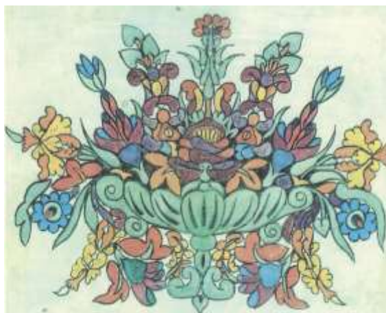
3. kép Matyó virágcsendélet zöld kagylóvázában (Lesznai–Képeskönyv 23.)