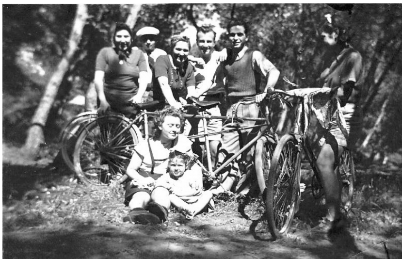
Image 19. Excursion à Guyotville, 1942

Après le début de la Seconde Guerre mondiale en septembre 1939, des Hongrois appelés sous les drapeaux en Algérie ont fait accomplir leur devoir. Après le débarquement des Alliés en novembre 1942, un bon nombre de Hongrois en Algérie a rejoint comme volontaires les rangs de la résistance contre l'Allemagne nazie en Tunisie et au Maroc. Ceux qui étaient naturalisés comme citoyens français ont participé à ces opérations militaires en Afrique du Nord dans les rangs de l'armée française, et ceux qui ne l'étaient pas, y ont pris leur part dans la Légion étrangère.