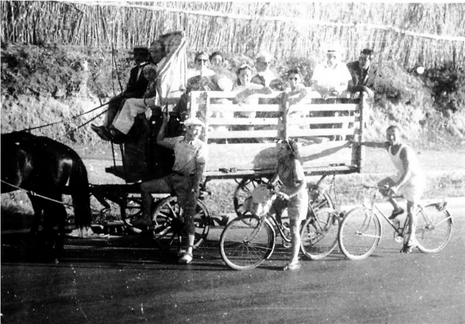
Image 18. Excursion à Guyotville, 1942