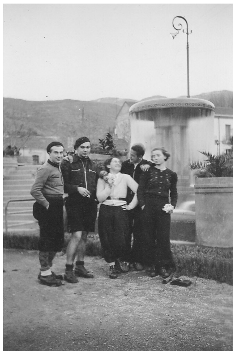
Image 14. Excursion à Blida, 1939