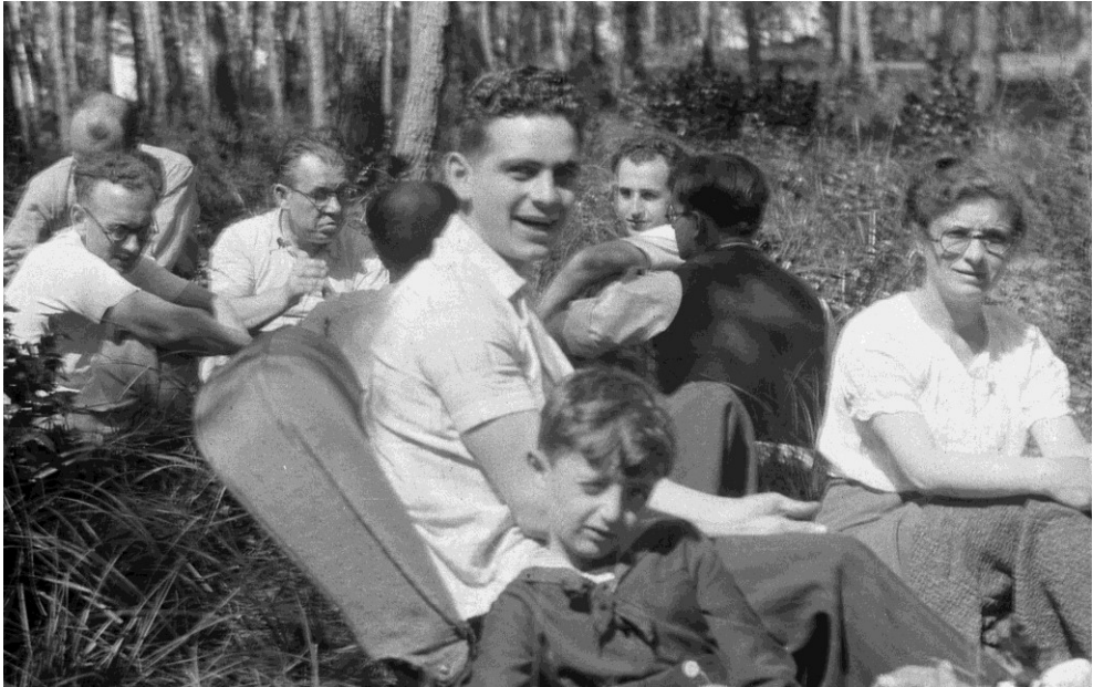
Image 11. Excursion, 1930

ment, je n'ai pas trouvé de photos de la pâtisserie hongroise d'Alger dont l'existence n'a pris fin que dans les années 1970.