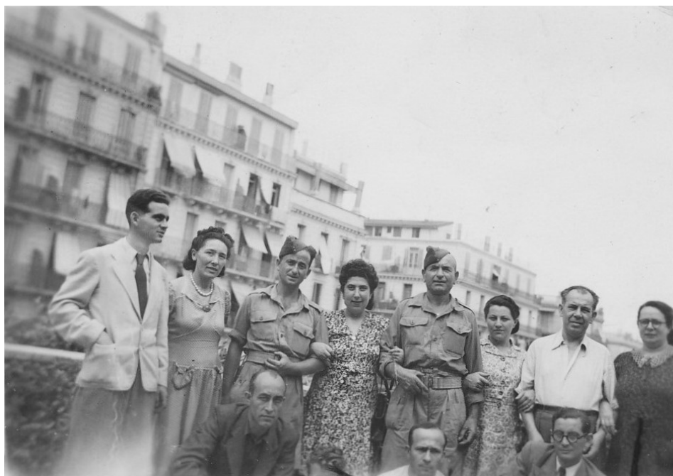
Image 8. Alger, 1946