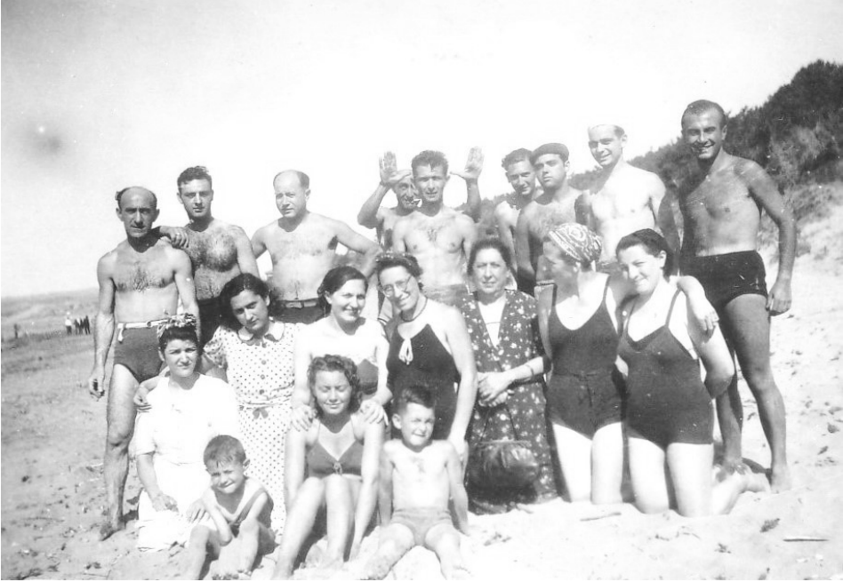
Image 17. Excursion à Sidi-Ferruch, 1941