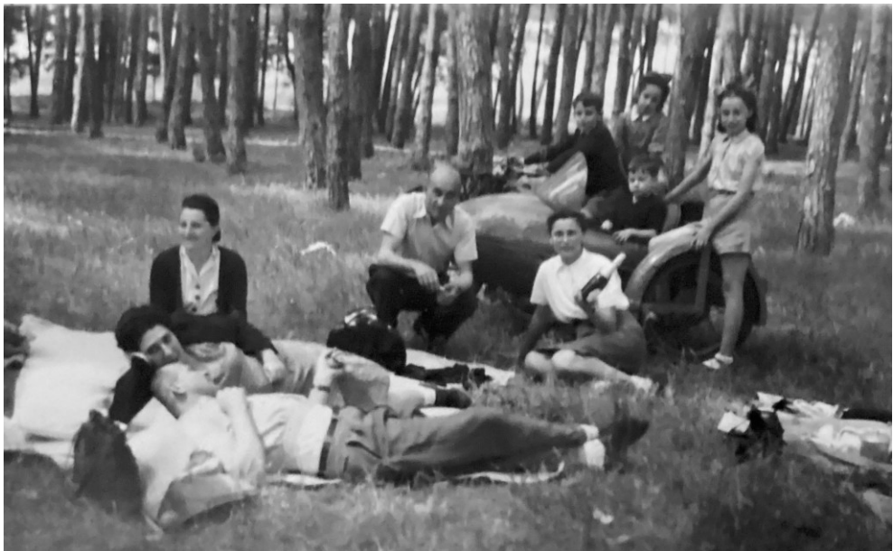
Image 12. Excursion autour d'Alger, 1930