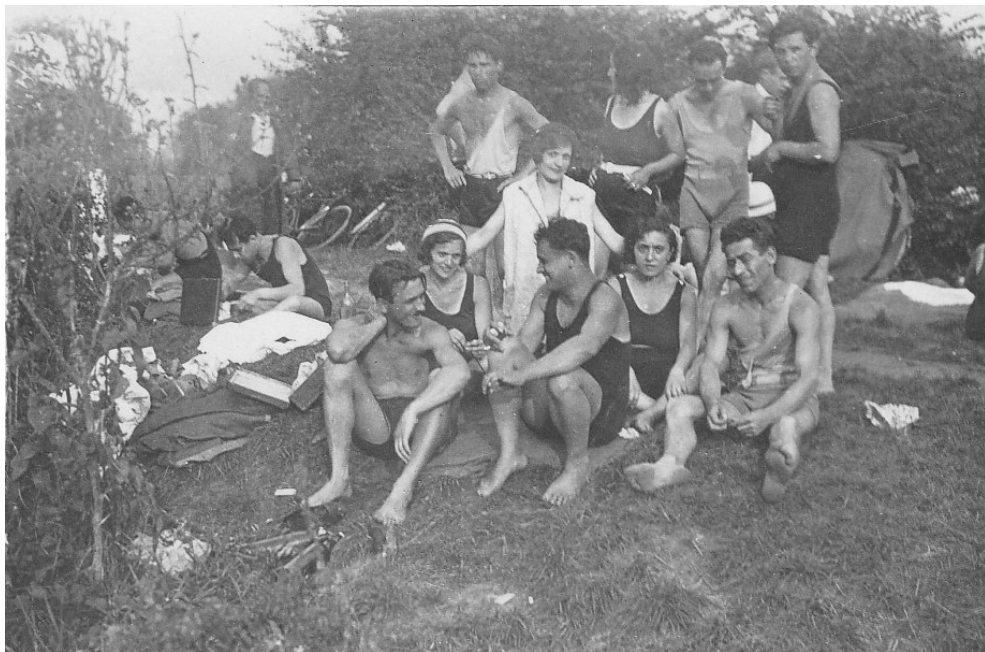
Image 13. Excursion autour d'Alger, 1930