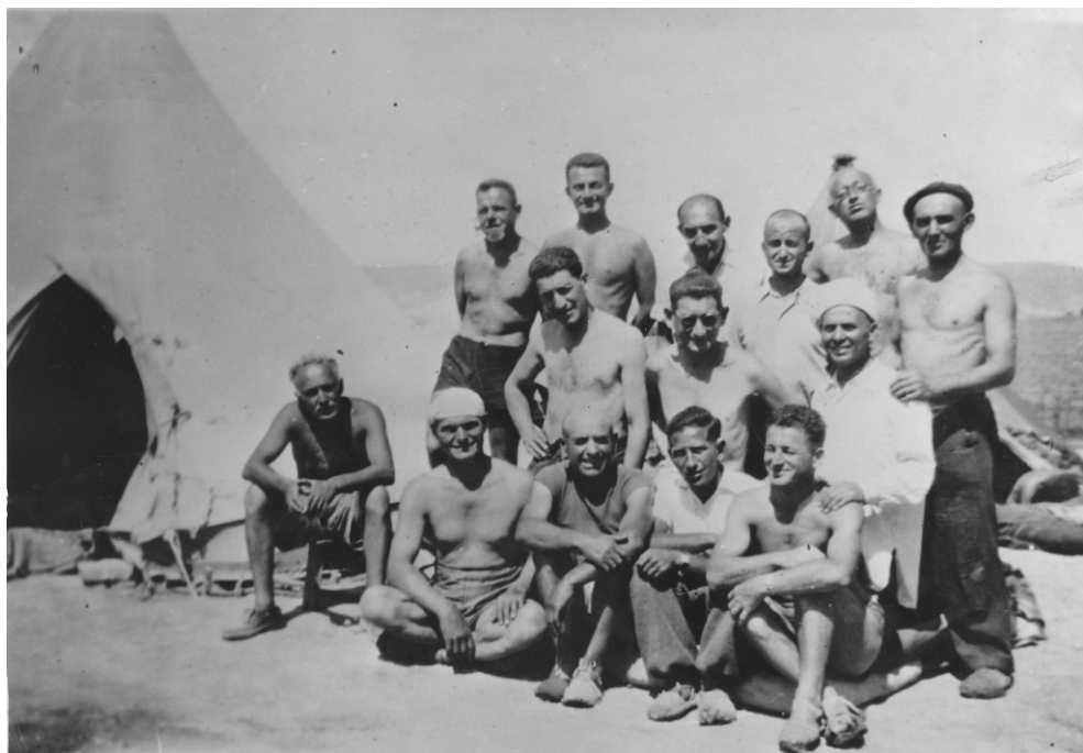
Image 22. Camp de Djelfa, 1942

Après la défaite en 1939 des républicains espagnols, eux et leurs alliés, des membres des Brigades internationales, dont des Hongrois, ont été transféré par le régime de Vichy au camp d'internement à Djelfa, à 300 km plus au sud d'Alger. Les Hongrois d'Algérie ont organisé en 1942 l'envoi de produits alimentaires aux internés qui étaient détenus dans des conditions atroces et, après la fermeture du camp de Djelfa en 1943, ils ont accueilli certains d'entre eux à Alger et ont facilité le processus de rapatriement des détenus vers leurs pays d'origine.