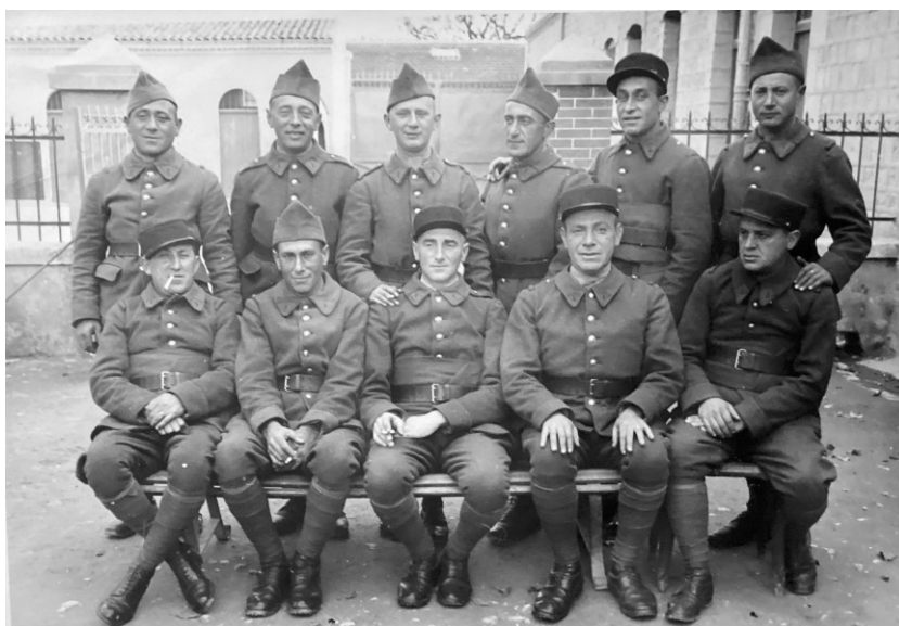
Image 20. Hongrois sous le drapeau français

Après le début de la Seconde Guerre mondiale en septembre 1939, des Hongrois appelés sous les drapeaux en Algérie ont fait accomplir leur devoir. Après le débarquement des Alliés en novembre 1942, un bon nombre de Hongrois en Algérie a rejoint comme volontaires les rangs de la résistance contre l'Allemagne nazie en Tunisie et au Maroc. Ceux qui étaient naturalisés comme citoyens français ont participé à ces opérations militaires en Afrique du Nord dans les rangs de l'armée française, et ceux qui ne l'étaient pas, y ont pris leur part dans la Légion étrangère.