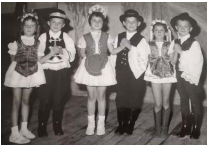
3. ábra: Magyar népviseletbe öltözött óvodások egy óvodai ünnepségen 5

hogy a két nemzetiség tagjai elfogadóak voltak egymással. Erre mutat példát Jakobovics Margarettá elmondása, miszerint: „Nagyon elfogadó volt a két nemzet egymás iránt, volt olyan is, hogy vendégségbe ment a szerb csoport a magyar csoporthoz vagy óvodába, illetve fordítva. Szerették, kedvelték egymást.” A szakmai pályafutása alatt mind az öt interjúalany magyar nyelven (anyanyelvükön) végezte az óvodai nevelőmunkát, viszont a szerbhorvátot mint környezeti nyelvet is tanították. Mindez arra utal, hogy az óvodapedagógus szakmához szükség volt mindkét (szakmai) nyelv ismeretére. A Holló Valériával készített interjúból betekintést kaphatunk abba, hogy a vegyes nemzetiségi óvodai csoportok esetében hogyan működtek a foglalkozások: „Amikor a magyar gyerekekkel tartottam foglalkozást, addig a szerb gyerekekkel foglalkozott a dada, majd pedig fordítva. Sokszor volt olyan is, hogy szülők kértek bennünket, hogy ne válasszuk el a gyerekeket, tartsunk nekik együtt foglalkozásokat, ezáltal is könnyebben tanulják meg a két nyelvet. Ilyen esetben megbeszéltük, hogy az egyik nap magyarul, a másik nap pedig szerb nyelven tartjuk a foglalkozásokat.” Az elbeszélések szerint, ennek köszönhetően, az a magyar gyermek, aki a vizsgált időszakban járt óvodába, biztosan megismerkedhetett a szerbhorvát nyelvvel.