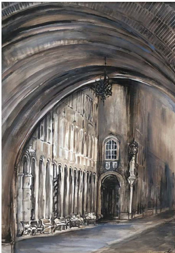
11. és 12. kép: Sonkodi Rita: Árkádok Dóm téri kapuja és A Dóm tér, festmény