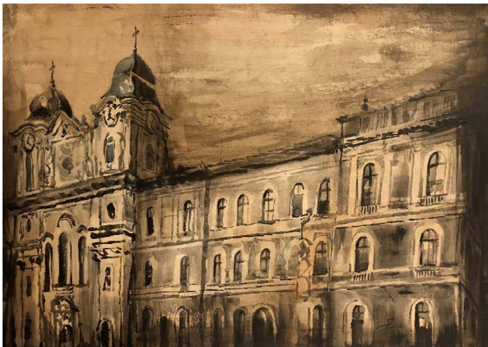
1. kép: Sonkodi Rita: Kolozsvári egyetem képe, festmény

E történetben egyetemi épületeket, meghatározó személyiségeket és a hozzájuk fűzhető tárgyakat örökítettem meg. Törvényszerű volt, hogy a Kolozsvári Egyetem régi épületével kezdjem, mely a templommal szorosan egybeolvadt az idők alatt, oly sokat mondva ezzel.