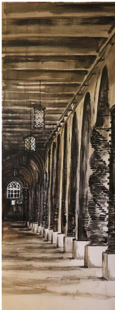
9. és 10. kép: Sonkodi Rita: Zenélő óra a Dóm téren és Árkádok, festmények

Az „egyetem záróköve” a Dóm tér keleti oldalán, az árkádok alatt, az SZTE Élettani Intézetének bejáratától balra található. Ezt a felirat nélküli, pekkelt, vagyis fogas vésővel vésett mészkő lapot Horthy Miklós 1930. október 24-én azért érintette meg egy díszkalapáccsal, hogy kifejezze: a szegedi egyetemi építkezések véget értek (Újszászi, 2021).