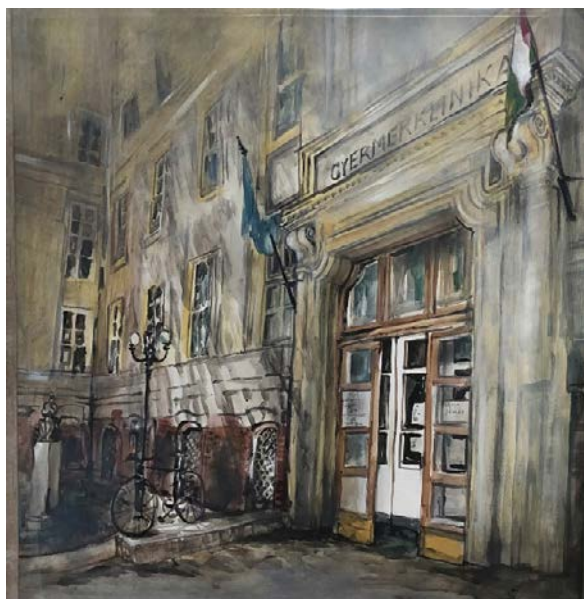
3. kép: Sonkodi Rita: A szegedi gyermekklinika, festmény

Amikor a kolozsvári egyetemet 1921-ben áthelyezték Szegedre, az akkor áttelepülő gyermekklinikának az 1903 óta működő Szegedi Városi Gyermekkórház (Graef Alapítványi Gyermekkórház) adott helyet a Kossuth Lajos sugárút 35. szám alatt. Vezetője Hainiss Elemér lett. Az oktatás a tanszékvezető jegyzete alapján működött, lényegében a német minta szerinti előadás és betegbemutató formájában. Klebelsberg Kuno, az akkori kultuszminiszter az egész szegedi egyetem építését a klinikákkal, azokon belül is a gyermekklinikával kezdte. Az egyetem alapkövének letétele egyben a gyermekklinika alapkövének letételét is jelentette, melyre országos ünnepség keretében 1926. október 5-én került sor. Ezt követően elképesztő gyorsasággal, két év, négy hónap alatt elkészült a már mostani helyén álló épület, melynek átadása 1929. március 11-én történt. Tervezője Ottovay István (1877–1945) volt. A két épületből álló klinika (a mai gyermekklinika és fül-orr-gégészeti klinika – ahol a fertőző gyermekeket különítették el) 28 kórtermében 96 ágyat helyeztek el. Ekkor már a most ismert előadó helyén lévő tanterem, valamint az első emelet déli szárnyán modern kialakítású csecsemő- és koraszülött részleg helyezkedett el. Az egyes kórtermek – számozás helyett – nagy gyermekorvosok nevét viselték: pl. Bókay, Cerny, Marfan, Schöpf-Merei. 1