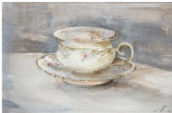
18. és 19. kép: Sonkodi Rita: Klebelsberg grófné báli táskája és Nagymamám kedvenc kávé csészéje, festmények

Emlékezünk Klebelsberg Kuno egykori kultuszminiszterre, és óvjuk emlékét, példát adva a ma emberének. A 2021. november 11-i Egyetem Napja programja részeként az SZTE vezetői megkoszorúzták Klebelsberg Kuno síremlékét és a 95 évvel ezelőtt kezdődő szegedi építkezések támogatóit bemutató „Egyetemalapítók” domborművet.