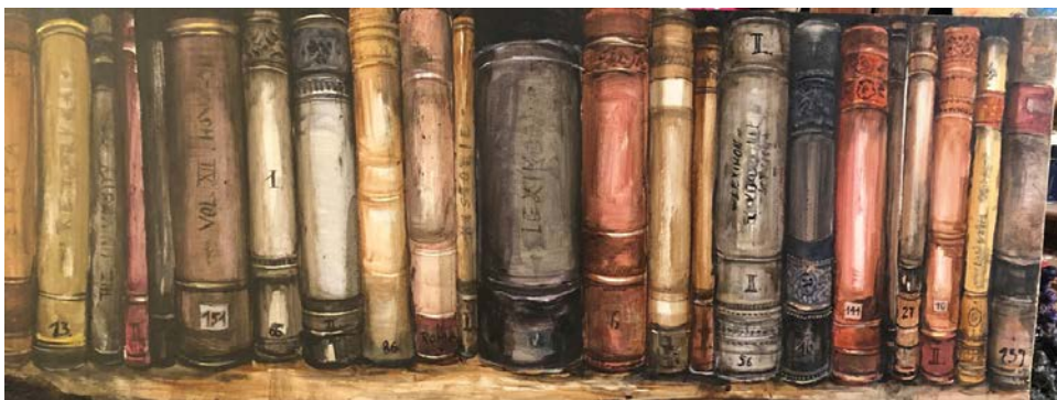
4. kép: Sonkodi Rita: Könyvespolc, festmény

Klebelsberg Kuno a hazai múzeumok ügyét is támogatta. Így született meg a Szépművészeti Múzeum és a megyei múzeumok. 1500 népkönyvtár nyílt, és ezt is a képben szerettem volna érzékeltetni, nem elfeledve az örökbecsű kötetek csodás külsőjét (4. kép).