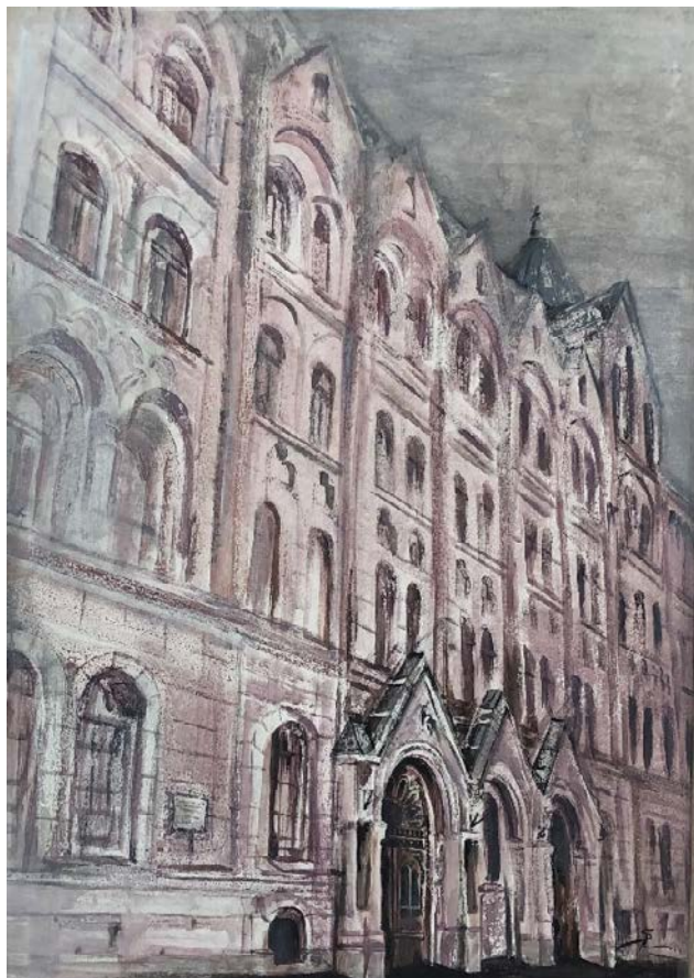
7. kép: Sonkodi Rita: Bölcsészkar épülete, festmény

Amikor 1921. október 10-én megkezdődött Szegeden az egyetemi oktatás, nemcsak egy város, hanem egy egész régió álma vált valóra. A város célkitűzései közt már a 18. századtól kezdve folyamatosan szerepelt egy olyan egyetem alapítása iránti igény, mely a kulturális és nemzeti értékekre tekintettel a nagy Alföld tudásközpontjává válhat. Ez a vágy végül a trianoni szerződés következményeként, az 1581-ben Báthory István által alapított kolozsvári jezsuita kollégium jogutódja, a Magyar Királyi Ferencz József Tudományegyetem Budapestre, majd végérvényesen Szegedre költözésével valósult meg. 4