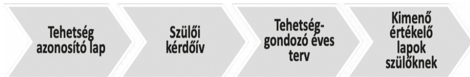
2. ábra: A tehetséggondozás dokumentumai

A 2. ábra a tehetséggondozás dokumentumait mutatja be.