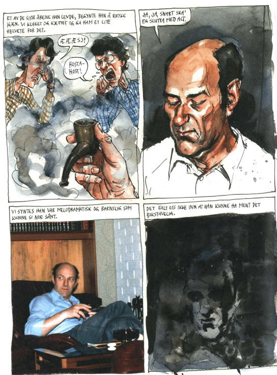
5. ábra. Kverneland 2018. Minden jog fenntartva. A szerző és a No Comprendo Press engedélyével.

a képregényalkotó kézjegyét, így a tudatában utólag kialakult benyomást tükrözi. Az apa és a fiai közti kapcsolat emléke, valamint az öngyilkosság pillanatának elképzelt látványa a fényképhez kapcsolódik. A fénykép így közvetít a keretelbeszélés eltervezett öngyilkosságra vonatkozó, extradiegetikus szintje és a rajzok által megkonstruált diegetikus világ között.