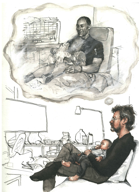
3. ábra. Kverneland 2018. Minden jog fenntartva. A szerző és a No Comprendo Press engedélyével.

felső félig szemből mutatja a két alakot. Az oldalon nem szerepel szövegdoz, a szíkontrasztok és a gondolatfelhő mint klasszikus képregénymegoldás azonban egyértelművé teszi, hogy a bemutatott helyzet főszereplője az alsó mezőben ülő, ölében csecsemőt tartó, gondolataiba merülő férfi. Mivel a rajz az ő gondolataihoz enged hozzáférést, feltételezhető az is, hogy ez a képregényalkotó jelenkori önarcképe.