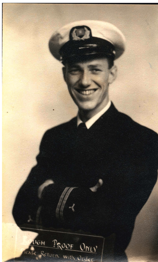
2. ábra. Kverneland 2018.

tón látható festményt összevethetjük a hátoldallal (2. ábra). A könyv borítójának hátsó oldalán ugyanis egy fiatal tengerésztisztet ábrázoló fotográfia látható. A testtartás és az egyenruha fazonja alapján kijelenthetjük, hogy ez a fotográfia a borítón szereplő portré eredeti változata. A sárgás, kissé életlen felvétel minden bizonnyal egy fényképész műtermében készült, mivel alsó sarkában egy angol nyelvű pecsét jelzi, hogy minta, amelyet rendeléskor vissza kell adni. Dátum ugyan nem szerepel rajta, de a portrékép színei, a felirat betűtípusa és a kép technikai kivitelezése arra enged következtetni, hogy a felvétel a múlt század derekán készült. A fényképen szereplő fiatal tiszt arcán széles, barátságos mosoly ül. Nyitott tekintete és a beállított helyzet ellenére is lazának tűnő testtartása magabiztosságot sugároz. Ez a benyomás éppen a borító elején látható festmény által keltett komor asszociációk ellenkezője. A képregény paratextusa ezzel a főleg vizuális elemek révén kialakított ellentéttel mediális, szemantikai és érzelmi ambivalenciát teremt, ugyanakkor az elbeszélés ívét, az elbeszélő mentális állapotának változását is érzékelteti: a memoár