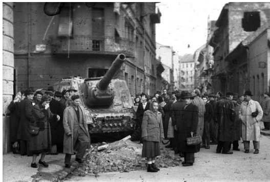
A tank utcai látványossággá vált a forradalom napjaiban

szervek, a munkástanácsok megalakításán buzgólkodtak. Milyen szerep jutott ebben a nőknek? A Csepel Vas- és Fémművek Kerékpárgyárában a dolgozók 80%-a például nő volt, döntő többségükben segédmunkás vagy betanított munkás. A munkástanács 1956. október 30-ai, alakuló jegyzőkönyvét 34-en írták alá tagként, köztük három nő — pedig a munkástanácsot kifejezetten reprezentatív szervnek szánták, és elnökéül is fizikai munkást választottak. 3 A nőknek adminisztratív szerep jutott: a munkástanács jegyzőkönyveinek vezetése, tüzelőutalványok kiállítása, stb. A munkástanács bürokratizálódásával megjelentek a szerv körül sürgölődő titkárnők is. A Csepel Vas- és Fémművek Központi Munkástanácsának elnökének például külön titkárnője volt. A munkástanács megalakításában tevékenyen részt vevő férfiak egyáltalán nem biztos, hogy beszámoltak feleségeiknek a gyári, politikai ügyekről. 4 Ebben a közegben nem a nők feladatának tekintették a gyári, illetve a politikai ügyek alakításának felelősségét. Az elsősorban vidéki, női munkaerőt nagy számban foglalkoztató munkahelyeken, például a háziipari szövetkezetekben azért nőket is bevásztottak a munkástanácsokba. Munkástanácselnöknek egyetlen gyárban választottak nőt, de ő is műszaki értelmiségi volt, Békefi Gabriella.