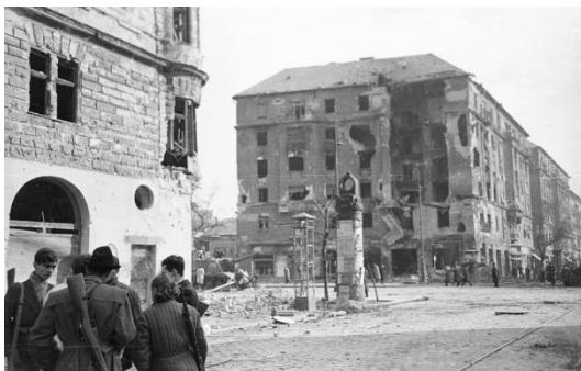
Előtérben fegyveres felkelők, közöttük egy felkelőnő — reális arány a fegyveres csoportokban

A kolleganómék nagyon ki akartak menni. A férjemet nagyon megagították. Es akkor mondta, hogy menjünk. De akkor mar ezeket vagy kétszer visszatereltek. Azt mondtam a férjemnek, hogy tudod mit, ha akarsz, menjél, en nem megyek. Mert ha elkap a honvágy, én visszajövök. Úgy össze... nem vesztünk össze, csak mondta, hogy te nem akarsz jönni. Mondtam, nem. Nekem ez megfelel. Mondtam, hogy nehogy azt hidd, hogy ott kolbászból van a kerítés. Nem tudok beszélni. Megtanulni nem olyan könnyű a nyelvet. Aztán végül is belenyugodott. Maradtunk. 6