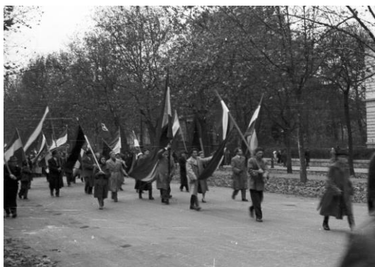
Tüntetés — a forradalom napjainak gyakori élménye

A jogászok megismertek minket, hogy középiskolások vagyunk, behúzkodtak a sorba minket, mosolyogtak ránk és szánkba adták a jelszavakat [Kiemelések — T. E. Zs.]. „Ki a magyar zászlóval!” – kiabáltuk, és az ablakokból zászlók szálltak alá lyukasan, mert kivágtak belőlük a címet. Egy néni egészen kihajolt az ablakon és teljes erejéből tapsolt. A Lánchíd csak úgy rengett alattunk, ahogy átmentünk rajta. Figyeltem az embereket, ahogy megálltak a hídon a tüntetést nézve. „Gyertek velünk!” – kiabáltuk, az arcokon tétovázást, örömet vettem észre. (Arrabona 1989, 33)