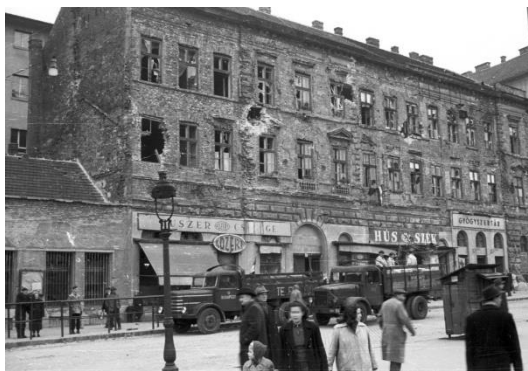
A forradalom napjaiban az utcakép néha a normalitás látszatát adta

A forradalom napjaiban a bizonyos elemeiben „férfiasnak” is minősíthető magatartás egyes értelmiségi nők visszaemlékezései alapján elemezhető. Az értelmiségi foglalkozású nők egy része vagy a munkahelyén, vagy baráti körben részt vett a bizottságok megalakításában, az események értékelésében, az újságszerkesztésben, a röplap-sokszorosításban.