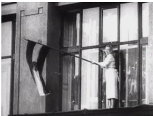
Lány fém zászlóval