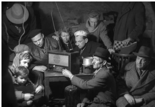
A pincékben a nyugati rádióadásokat hallgatták