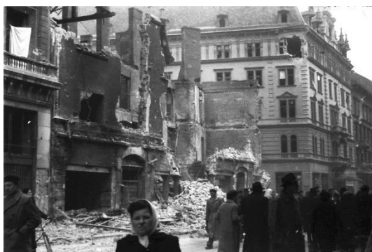
Forradalmi utcakép előtérben fehérfekendő nővel