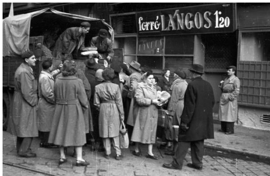
Kenyérért sorban álló nők — a hagyományos női szerep

Az 1956-os forradalmat a „férfiak forradalmának” szokták nevezni. Ennek fő oka, hogy mind az ellenforradalom, mind a forradalom ábrázolásakor a történészek többnyire olyan kérdésekre kerestek választ, amely a férfiak „politikacsinálását” helyezte a középpontba. 1 Vizsgáljuk meg: miként élték meg a nők 1956-ot? Hatott-e a korszak egyenjogúsító beszédmódja a nők forradalomban való részvételére? A hagyományosnak tartott társadalmi elvárások szerint a női élet kiteljesedéséhez nem tartozik hozzá az aktív politikai szerepvállalás (Neményi 1999, 10). A hagyományos női szerepfelfogások szerint a nő elsősorban anya, feleség, tevékenységeinek színtere az otthon, ahol családját ellátja, gyermekeit neveli, érzelmi jellegű szerepet tölt be: biztosítja a családtagoknak az „otthon melegét”. E felfogás szerint a nő a gyermekneveléssel, a családellátással járó kööttségek miatt nem is vágyakozik a politika színtereire, legfeljebb abban az életkorban, amikor viszonylag szabadabb: a serdülőkor és a férjhezmenetel közötti időszakban, vagy gyermekeinek „fészekhagyása” után, hacsak a nagymamai teendőik nem foglalják le idejét.