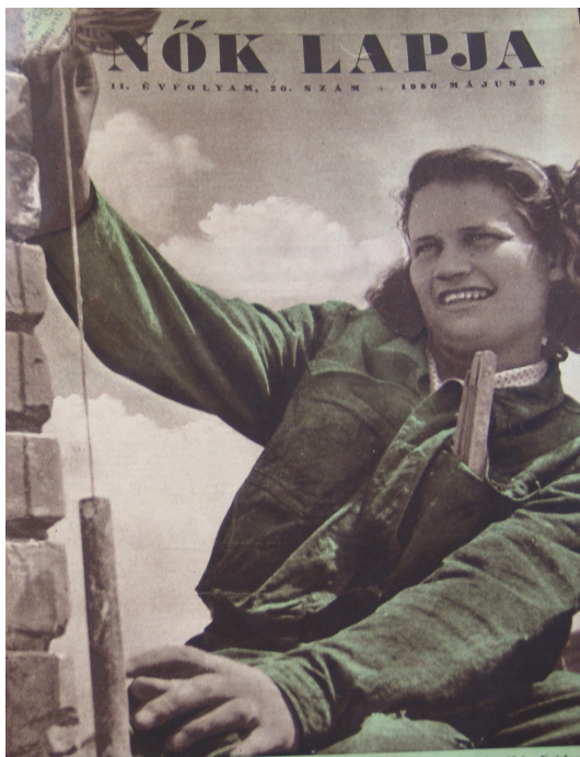
1. kép: Munkásnő overálban

munkakörülmények között. Nekik kellett megtestesíteniük a szocialista munkamorált.