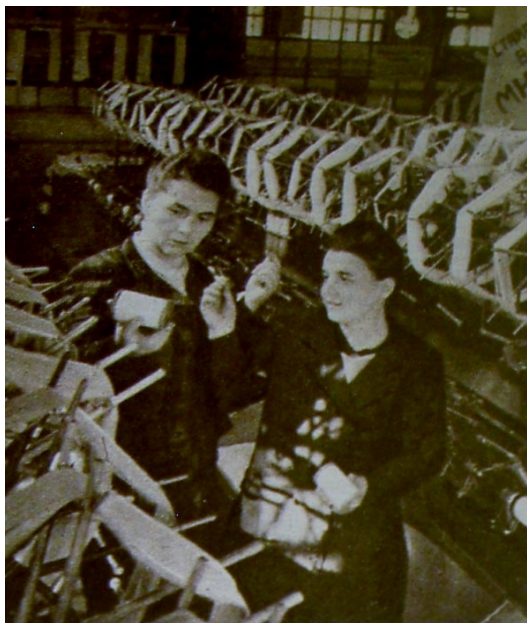
3. kép: Bogdanova a gyárban

Melyik a központi szerepű vonása ennek a szovjet szupernő-metaforának? Ő egy olyan hős, aki egyszerű származásból indulva hatalmas előrelépést tett meg a tanulásra épülő társadalmi felemelkedésen keresztül. Ugyanolyan otthonosan mozog a szövönők, mint a mérnökök között. Ugyanolyan jártas a technológiai, mint a munkásokra vonatkozó szociális kérdésekben. Sajátjaként tekint a gyárra, és úttörőként dolgozik a technológia fejlesztéséért, valamint a termelés minőségének emeléséért. Végül, de nem utolsó sorban: Bogajeva „igazi nő”, aki kellemes otthont teremt férjének. A Bogajevában megformált szovjet ikon jelentőségteljes a mérnöknő mint példakép megformálásában a személyi kultusz Magyarországnak szocialista női számára.