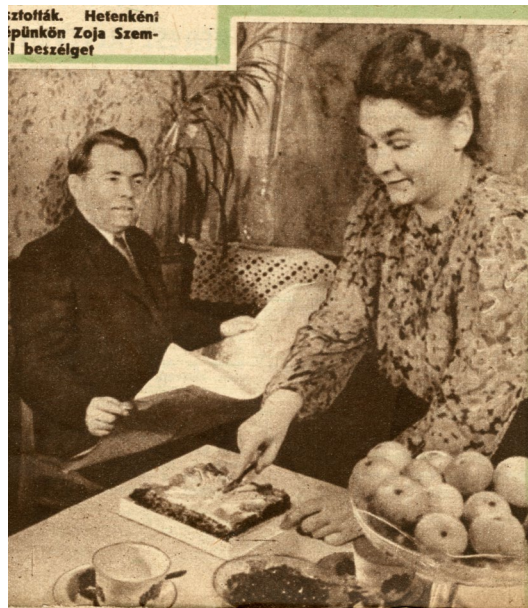
2. kép: Bogdanova otthonában

benyomást keltette, hogy ezek a szocialista nők, akik korábban csak férfiak számára nyitott szakterületeken érvényesülnek, és vezető pozíciót töltenek be, olyan „normális” nők, akik gondoskodnak családjukról, nevelik gyerekeiket, berendezik otthonaikat és ápolják külsejüket (2. kép). A bemutatott fiatal traktoros lányok erejüket mind a szocialista mezőgazdaságért végzett kemény munkába, mind a hozományukhoz szükséges pénz összegyűjtésébe fektették bele (Farkas 2003).