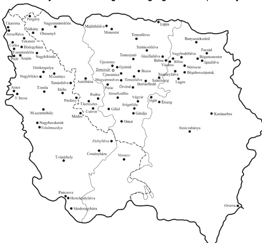
2. térkép: a Bánág magyar nyelvű elemi iskolái (1920/21-es tanév) Map 2.: Elementary schools of Hungarian language in Banat (school year 1920/21)