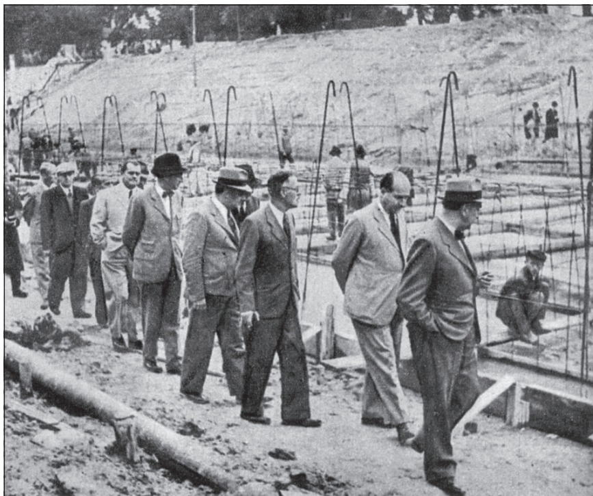
Figure 4. Baron Dániel Bánffy Minister of Agriculture (second from the right) with Lajos Reményi-Schneller Minister of Finance and János Bárczay Secretary of State for Agriculture, while inspecting the building of the new lock at Siófok, part of Sió Channel construction works – October 1943 (photo: Károly Oláh)

Forrás: Tolnai Világlapja. 1943. október 6. 45. évf. 40. szám. 3. old.